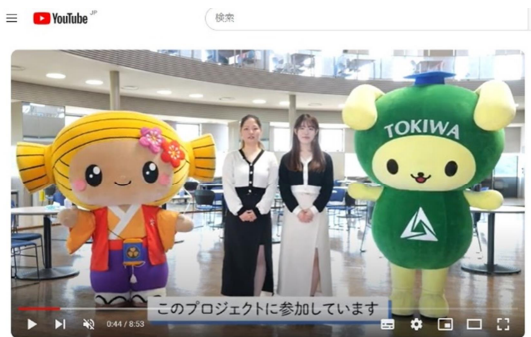
水戸市安心・安全見守り隊～参加企業・団体 活動紹介～

常磐大学の学生さんが「水戸市安心・安全見守り隊」の参加企業・団体にインタビューを行い活動を紹介するPR動画を公開中です。また、広報啓発用のキーホルダーも配布中ですので、御希望の方は御連絡ください。