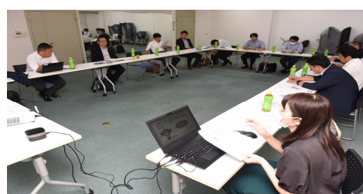
令和6年9月26日 茨城北部読売会水戸支部 様