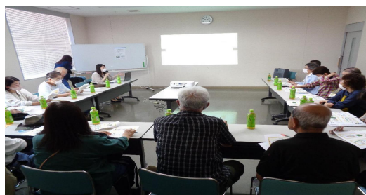
令和6年6月4日 お散歩パトロール隊 様

市の担当者が職場や集いの場等にお伺いし、事例等を交えながら地域における見守り活動のポイントをお伝えする説明会や、参加者同士で交流する情報交換会を実施しています。