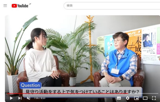
水戸市安心・安全見守り隊～参加企業・団体 活動紹介～